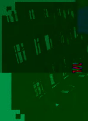
商贸管理类专业 综合训练场所